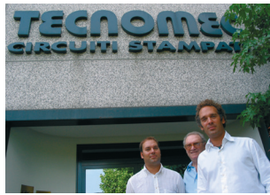
I titolari della Tecnomec Srl

L'azienda è strutturata per produrre componenti per elettronica industriale, automotive, telecomunicazioni, militare, medicale e lighting