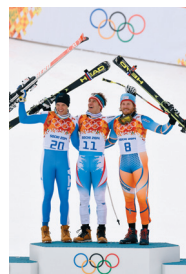
Un podio composto da atleti che vestono tessuti Plastotex