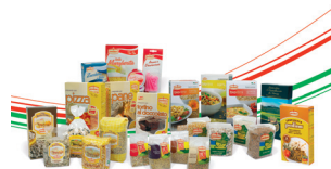
Una panoramica prodotti

e novità: una linea di cereali e legumi da eccellenze italiane, eventi con Chef stellati e l'avvio ufficiale della Lean Production System, prima impresa del settore ad adottare un sistema produttivo ed organizzativo "snello". Tra i prodotti che saranno lanciati sul mercato in questo anno vi è la