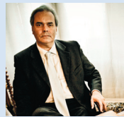
Achille Variati, sindaco di Vicenza

A Vicenza un ruolo fondamentale in questo senso lo sta assumendo l'università che raggiunge anno dopo anno sempre maggiori successi, sia in termini di iscrizioni, sia di ingressi nel mondo del lavoro al termine del percorso di studi, con una media altissima di giovani che trovano un'occupazione a pochi mesi dal diploma.